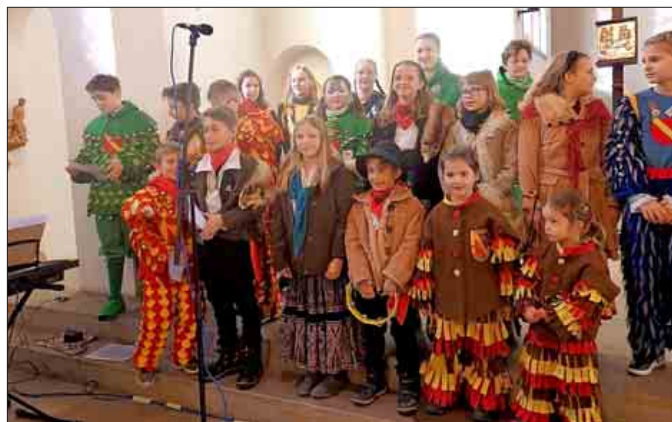
Eine musikalische Bereicherung mit frischen Stimmen: Der Narre-Some-Chor bei der Narrenmesse.

Es war eine Heilige Messe voll froher Stimmung, die trotz des närrischen Tenors das Gotteslob in den Mittelpunkt stellte. Dazu passte auch, dass vor dem Altar eine Reihe der kunstvoll gear-