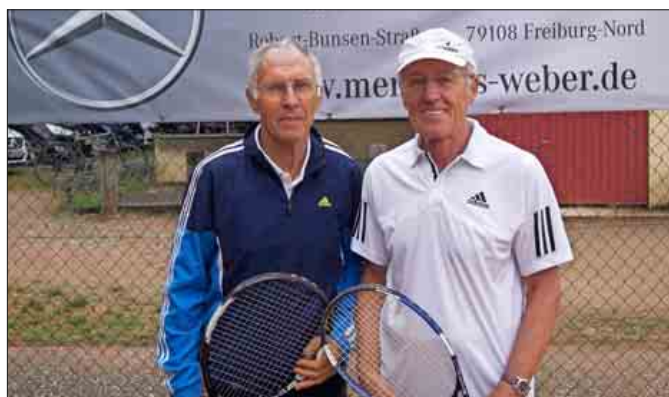
Das Finale der Herren in der Altersgruppe 65