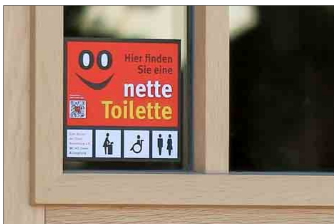
Die nette Toilette im Bildungshaus Bonifacius Amerbach ist sowohl behindertenfreundlich als auch zum Wickeln geeignet.

oder Einzelhändler, der während seiner Öffnungszeiten seine Toilette jedem Bedürftigen zur Verfügung stellt, einen monatlichen Zuschuss zu seinen Reinigungskosten. In Neuenburg am Rhein beträgt dieser Zuschuss 50 Euro monatlich, ist die Toilette noch dazu behindertenfreundlich oder mit Wickelmöglichkeit ausgestattet, erhält der Besitzer nochmals je 25 Euro zusätzlich. Als weiterer Pluspunkt für die Toilettenbetreiber ist zu sehen, dass die Hemmschwelle, ein Restaurant zu betreten sinkt, und nachdem man von der Toilette zurückkehrt lässt man sich vielleicht sogleich in nettem Ambiente nieder und genießt noch einen Kaffee, bevor man weiterzieht. Bürgermeister Joachim Schuster sieht in der Einführung der Aktion einen weiteren Schritt, sich als gastfreundliche Stadt auf die Landesgartenschau im Jahre 2022 vorzubereiten. Doch ergänzend sollen noch zwei öffentliche, sich selbst reinigende Toilettenanlagen gebaut werden. Beide werden gegen Gebühr nutzbar sein und 24 Stunden am Tag geöffnet haben. Eine Anlage soll hinter dem Rathaus errichtet werden, die andere auf dem Konstantin-Schäfer-Platz, denn auch die Öffnungszeiten der netten Toiletten sind irgendwann überschritten. Doch diese Toilettenanlagen sind teuer. „Rund 100.000 Euro pro Anlage werden anfallen, so dass wir planen, pro