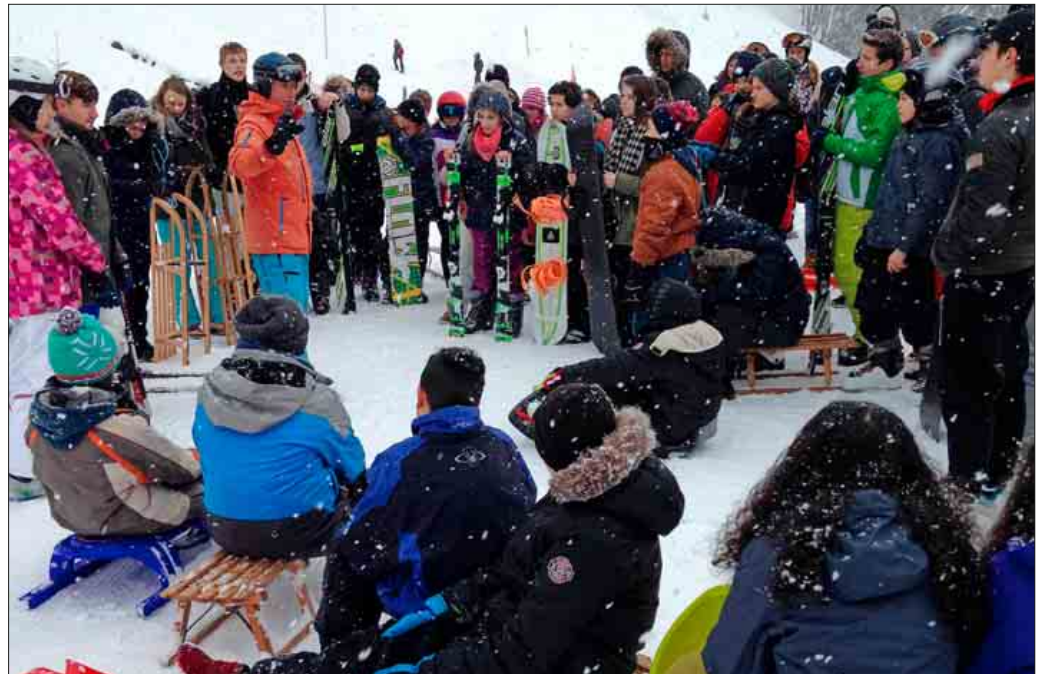
Dicke Schneeflocken heißen die Schüler im Schneesportzentrum „Notschrei“ willkommen

Alle Schüler der Werkrealschule durften einen erlebnis- und schneereichen Tag im Schwarzwald verbringen, nur die vier Prüfungsklassen mussten die Schulbank drücken. Mit Skiern, Snowboard oder Schlitten heizten die Schüler zusammen mit ihren Lehrern die Pisten hinab – manche schon als wahre Könner, andere machten ihre ersten Erfahrungen mit Skiern oder auf dem Snowboard, einzelne erlebten Schnee in dieser Fülle sogar zum ersten Mal. Neben der großen Gaudi in märchenhaft verschneiter Schwarzwaldlandschaft, lernten einige Schüler auch ihre Grenzen kennen: sei es den Mut aufzubringen, die steile Piste vor Augen, talwärts zu rutschen, oder der Kälte und Nässe zu trotzen. Begeisterte Stimmen waren nach der Rückkehr zu hören: „Coole Sache!“ „Am Anfang war Skifahren schwer. Dann habe ich mich aber den ganzen Hang auf meinen Skiern hinuntergetraut!“ „Es hat wahnsinnig geschneit! Ich musste da ganz vorsichtig fahren!“ „Wir sind zu