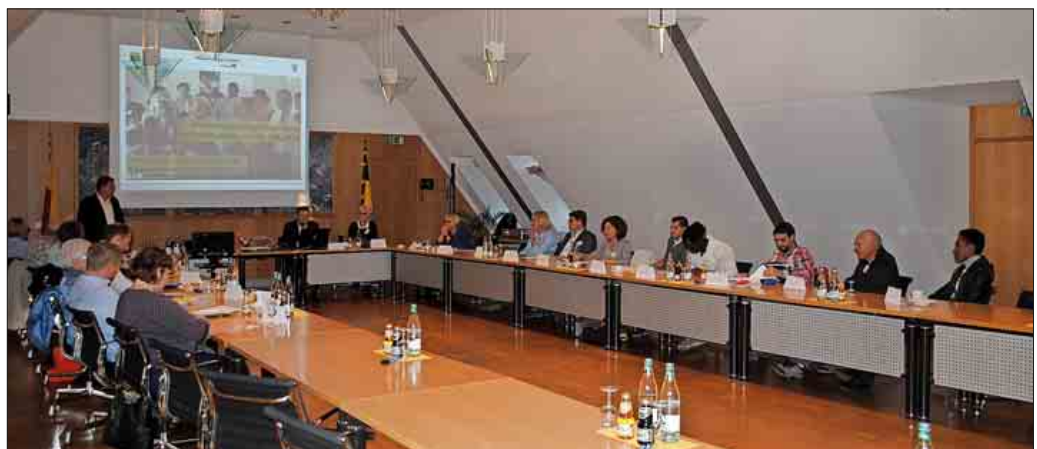
Bürgermeister Joachim Schuster begrüßte die Begleitgruppe

Am 10. Oktober 2018 ab 17.30 Uhr traf sich die Begleitgruppe des Vorhabens zu ihrem ersten Planungsworkshop im Sitzungssaal des Rathauses. Sie setzt sich zusammen aus Ver-