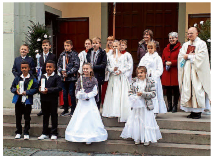
Am Sonntag, den 18. Oktober 2020 feierten in der Liebfrauenkirche zehn der Kinder ihre Erstkommunion. Mit ihren Familien, einer kleinen Band und schönem Kirchenschmuck war es trotz Corona ein festliches Ereignis.

Informationen zu weiteren Gottesdiensten in der Seelsorgeeinheit Markgräflerland finden Sie auf der Homepage ( www.se-markgraeflerland.de ) oder im Pfarrblatt, das in den Kirchen ausliegt.