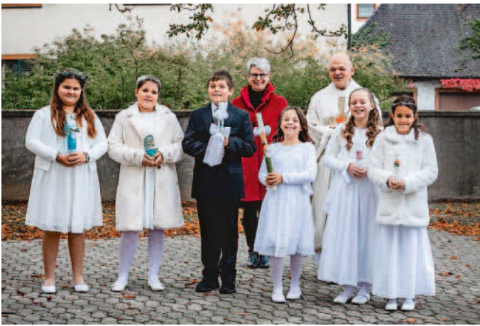
Am Samstag, den 17. Oktober 2020 feierten in der Kirche St. Michael in Griebheim sechs Kinder ihre Erstkommunion. Mit ihren Familien, einer kleinen Band und schönem Kirchenschmuck war es trotz Corona ein festliches Ereignis.