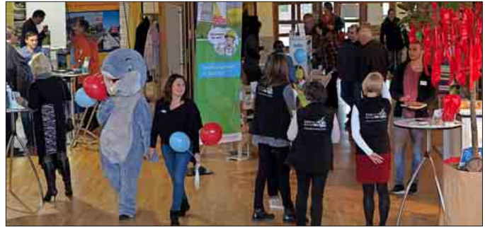
Lebhafter Betrieb herrschte vor allem am Sonntag auf dem ersten grünen Marktplatz im Neuenburger Stadthaus

Seit vielen Jahren sei der Klimaschutz in Neuenburg schon Thema, sagte Bürgermeister Schuster im Rahmen eines Mediengesprächs und verwies darauf, dass die Stadt schon zweimal mit der Silbermedaille des European Energy Award ausgezeichnet wurde. Der „grüne Marktplatz“ solle die die Vielfalt der Möglichkeiten zeigen, bei denen die Bürgerinnen und Bürger selbst aktiv werden können. Um die Themen zu bündeln wurde unter drei Stichworten agiert: Neuenburg baut, Neuenburg ist mobil und Neuenburg bewegt. In diese drei Themenfelder lässt sich nahezu alles einordnen, was mit dem Schutz von Klima und Umwelt zusammenhängt und sich auf die konkrete Situation vor Ort anwenden lässt. Für die Information der Bürgerschaft hat sie Stadtverwaltung eigens das Maskottchen „Rheiner“ aus der Taufe gehoben. „Rheiner“ ist überall dort präsent, wo es Baumaßnahmen zu erklären gibt, wenn Flyer zu Einzelthemen verteilt werden oder wenn auf spezielle Beratungsangebote aufmerksam gemacht wird. Das zweitägige Angebot eines familienfreundlichen „Infotainments“, bei dem neben der Sachinformation auch Spiel, Spaß und Kulinarik nicht zu kurz kommen, wurde vor allem am Sonntag genutzt. Soll ich meinen Hof mit Öko-Pflaster ausstatten? Wel-