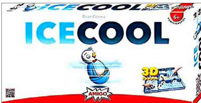
Kinderspiel des Jahres 2017: „Icecool“

Stadtbibliothek, Bildungshaus Bonifacius Amerbach, neue Gesellschaftsspiele für die ganze Familie erkundet und gemeinsam gespielt werden. Drei spielbegeisterte Bibliotheks-Nutzerinnen haben die Spiele bereits ausprobiert und erläutern die Spielanleitungen. Kinder und Eltern oder Großeltern sind herzlich eingeladen. Anmeldung nicht erforderlich.