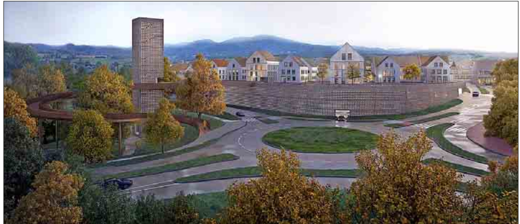
Das Parkhaus als stadtbildprägendes Element: So zeigt es die Planzeichnung der Siegerarbeit im städtebaulichen Wettbewerb, nach der das Projekt realisiert werden soll. Foto: Visualisierung Areal Kronenrain MONO Architekten PartGmbH Berlin

Auch der Bebauungsplan „Kronenrain“, die planungsrechtliche Grundlage für den Bau des Parkhauses ist nun beschlossen. Der Gemeinderat befürwortete das Planwerk in seiner jüngsten Sitzung einstimmig, nachdem nach der Offenlage die Behörden, Träger öffentlicher Belange und Privatpersonen ihre Stellungnahmen abgegeben hatten. Auch hier hatten umfangreiche Voruntersuchungen zu Artenschutz, Lärmschutz, Umwelt, Verkehrsplanung, Luftschadstoffen, Kampfmittelbeseitigung und Denkmalschutz stattgefunden. Das gesamte Projekt sei vollständig unabhängig von den Planungen zur Landesgartenschau, betonte Bürgermeister Joachim Schuster. Die dort entstehenden rund 230 Parkplätze seien nicht relevant für die Planungen der Gartenschau. Hierfür werden eigene temporäre Parkplätze direkt am LGS-Gelände angelegt, die danach wieder in Ackerland umgewandelt werden. Durch den