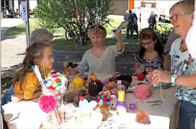
Unter versierter Anleitung konnten an einem Stand lustige Tiere aus Wolle gebastelt werden

gartens. Lebendige Tiere anfassen gehört zumindest für Kinder unbedingt dazu, wenn es um die Natur geht. Hier waren neben dem Kaninchen-Streichelzoo des elsässischen Züchters Bernard Meyer die stattlichen Comtois-Pferde des Vereins „Traits de Haute Alsace“ eine weitere Attraktion und ein Novum auf der „Natur-e“. Die Kraft der Zugpferde als erneuerbare und umweltschonend eingesetzte Energie wurde anschaulich gemacht, indem eins der Pferde