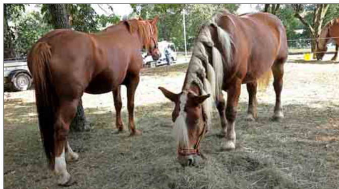
Ein Hingucker auf der „Natur-e“: Comtois-Arbeitsperde

Zum 17. Mal fand in Chalampé rund um die Festhalle die binationale Ausstellung mit Bauernmarkt „Natur-e“ statt. Die Veranstalter, die Mulhouse Alsace Agglomération (m2a) sowie die Kommunen Chalampé und Neuenburg am Rhein hatten wieder eine ganze Reihe von interessanten Ausstellern, regionalen Erzeugerbetrieben und naturkundlichen Institutionen für eine Prä-