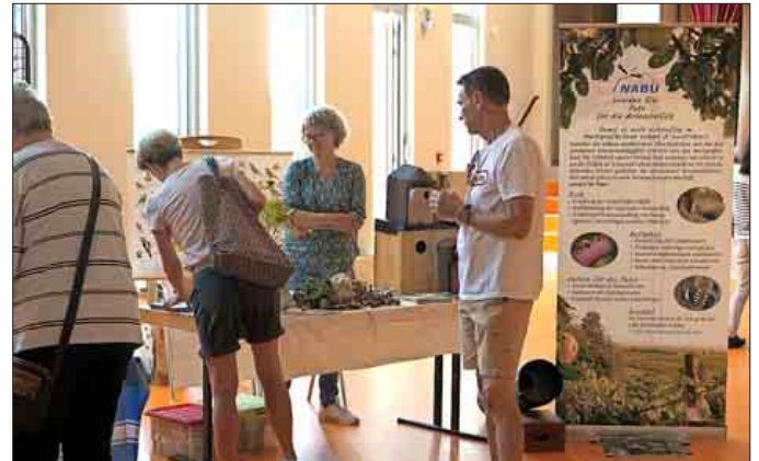
Am Stand des NABU Müllheim