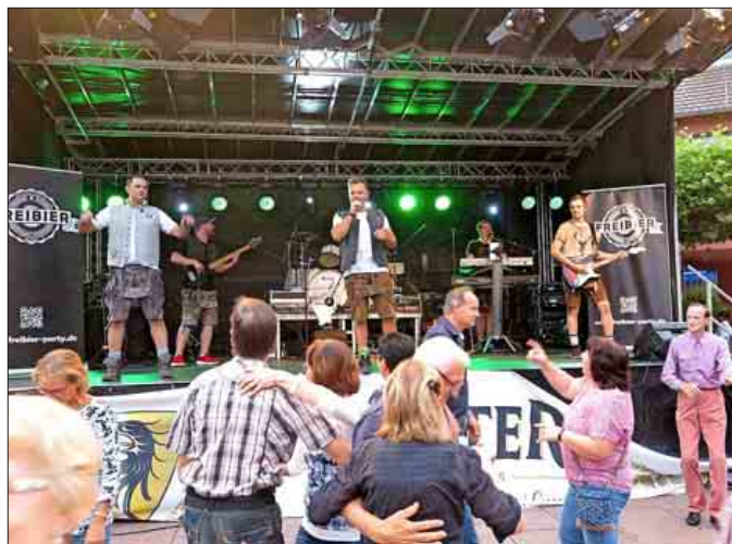
Da hält es keinen mehr auf dem Stuhl: „Freibier“ lassen es krachen