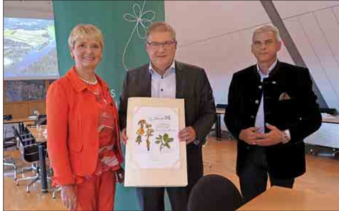
Bürgermeister Joachim Schuster (Mitte), überreicht Friedlinde Gurr-Hirsch die Urkunde der Baumpatenschaft für eine Traubeneiche und ernennt sie damit zur Botschafterin für die LGS. Rechts Dr. Patrick Rapp, Landtagsabgeordneter und Sprecher der CDU-Fraktion für die Themen Tourismus, Naturschutz und Forst.

Die Stadt Neuenburg am Rhein bereitet sich schon seit 2010 auf die Landesgartenschau (LGS) 2022 vor. Das Thema wird seither in allen kommunalpolitischen Entscheidungen mitgedacht, was Friedlinde Gurr-Hirsch, Staatssekretärin im dafür zuständigen Ministerium für ländlichen Raum und Verbraucherschutz bei ihrem jüngsten Besuch in Neuenburg am Rhein ausdrücklich lobte. Neben Planungen und Baumaßnahmen geht es auch um ideale Dinge: Seit 2011 vergibt die Stadt Baumpatenschaften an prominente Entscheidungsträger, die mit diesem Status zu „Botschaftern“ der LGS 2022 werden. Gurr-Hirsch ist in dieser Reihe nun die neunte Botschafterin. Im Rahmen ihres Besuchs erhielt sie die schön gestaltete Urkunde zur Pflanzung einer Traubeneiche die im Gartenschaugelände mit einer erklärenden Plakette versehen wird. Die Baumarten, die auf die Botschafterinnen und Botschafter hinweisen werden aus der Liste der Bäume des