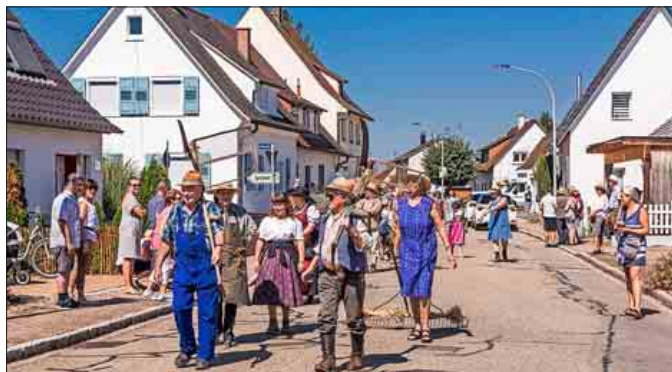
Höhepunkt ist der Brauchtumsumzug am Sonntagmittag mit allerlei bäuerlichen Gerätschaften aber auch Trachtengruppen aus dem Markgräflerland.

Höhepunkt war einmal mehr der Brauchtumsumzug am Sonntagmittag durchs Dorf.