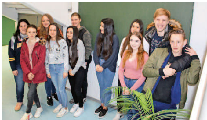
Diese Werkreal-Schülerinnen und Schüler sind bereit – bald beginnt ein neuer Lebensabschnitt

Die Mathias-von-Neuenburg Schule ist ein Verbund aus Werkreal- und Realschule. Die Realschule besteht seit mehr als 20 Jahren, ist als offene Ganztagschule konzipiert und wird von rund 380 Schülern besucht. Sie ist zwei- bis dreizügig und hat ein besonderes Profil, das aus den Bereichen Sprachen, Sport und Kunst besteht. Die Werkrealschule ist eine ein- bis zweizügige Schule neuen Typs. Sie führt in einem durchgehenden Bildungsgang bis Klasse 10 zum mittleren Bildungsabschluss und bietet weiterhin den Hauptschulabschluss an. Zusätzlich wird der Übergang in das duale Ausbildungssystem vorbereitet und somit die Grundlage für eine gelingende Berufsausbildung geschaffen. Die Werkrealschule ist ebenfalls eine offene Ganztageschule. Durch den Schulverbund mit der Realschule eröffnet sich zudem die Möglichkeit des fließenden Wechsels bei entsprechenden Leistungen. Werkreal- und Realschule bilden zusammen mit der Rheinschule - Grundschule ein Schulzentrum, zu dem neben den zwei Sporthallen eine Cafeteria und ein Hallenbad gehören.