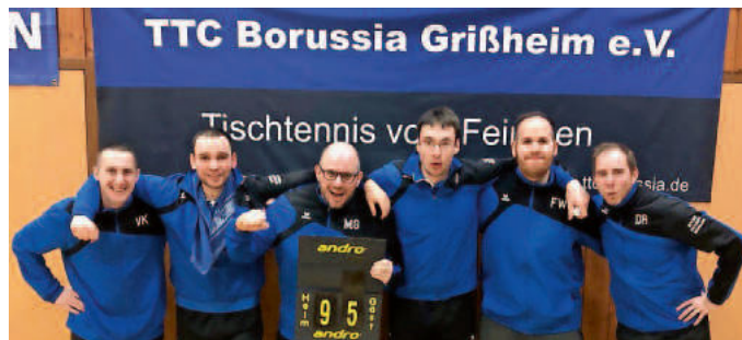
Freude nach dem Sieg der Ersten gegen Suggental

Das einzige Leuchtfeuer der Borussia stellt momentan die neu formierte vierte Mannschaft dar. Mit gerade einmal einer Niederlage – gegen den aktuellen Tabellenersten – steht die Vierte auf einem sagenhaften 2. Tabellenplatz. Der Rückrundenstart gelang ebenfalls furios und überzeugend. Die ersten 3 Spiele endeten mit 3 Siegen, in denen der Gegner maximal auf 4 Punkte kam. Der Drittplatzierte Britzingen ist mit 8 Punkten Unterschied bereits abgeschlagen und musste sich mit 9:0 Punkten in der Rückrunde bereits geschlagen geben. Es müsste also noch einiges passieren, dass unserer Borussia ein Aufstiegsplatz streitig gemacht wird. Am 29.02.2020 steht das Spitzenspiel zu Hause gegen den Tabellenersten Untermünstertal II an. Hier könnte man sich mit einer starken Leistung sogar noch Chancen auf den Meistertitel ausrechnen. Es bleibt also auch bei unserer Vierten noch spannend. Mehr Informationen rund um den TTC gibt es unter: www.ttcborussia.de