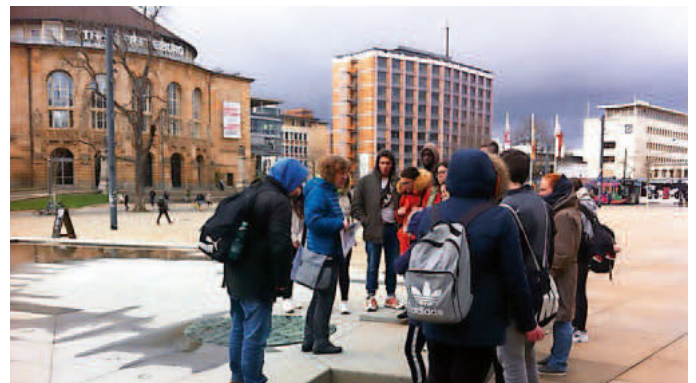
Am Platz der Alten Synagoge in Freiburg

fließenden Wechsels bei entsprechenden Leistungen. Werkreal- und Realschule bilden zusammen mit der Rheinschule – Grundschule ein Schulzentrum, zu dem neben den zwei Sporthallen eine Cafeteria und ein Hallenbad gehören.