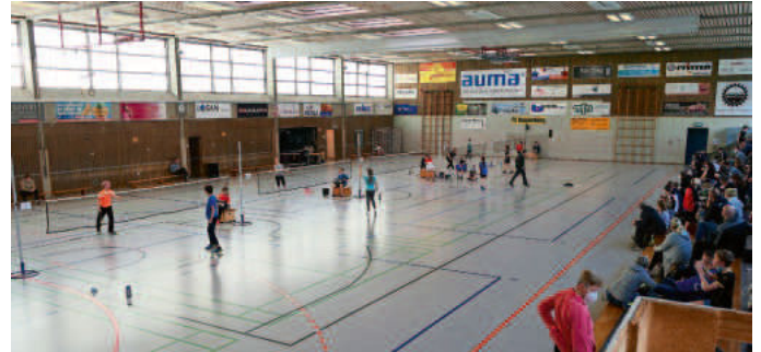
Blick in die Halle I der Realschule

Das nächste Turnier in Neuenburg soll dann am 27. November stattfinden. Zum ersten Mal in der Vereinsgeschichte haben wir den Zuschlag für eine Bezirksrangliste bekommen, an der neben Einzel auf Doppel gespielt wird. Der Einzugsbereich verdoppelt sich im Prinzip und umfasst ganz Südbaden.