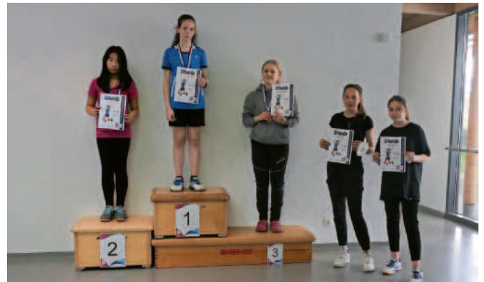
Siegerehrung Mädchen U15