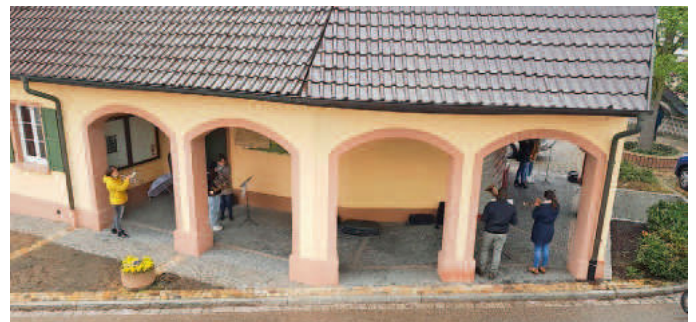
Musikverein „Eintracht“ Grißheim