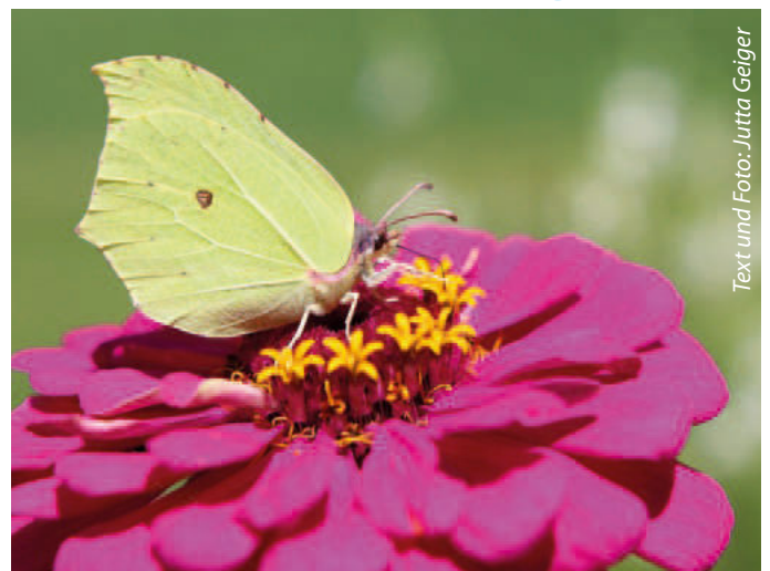
Text und Foto: Jutta Geiger

Mit einer Lebensdauer von einem Jahr ist der Zitronenfalter unser ältester Tagfalter. Wie er das schafft? Durch zwei Ruhephasen, eine im Winter, eine im Sommer, in denen der Stoffwechsel stark heruntergefahren wird.