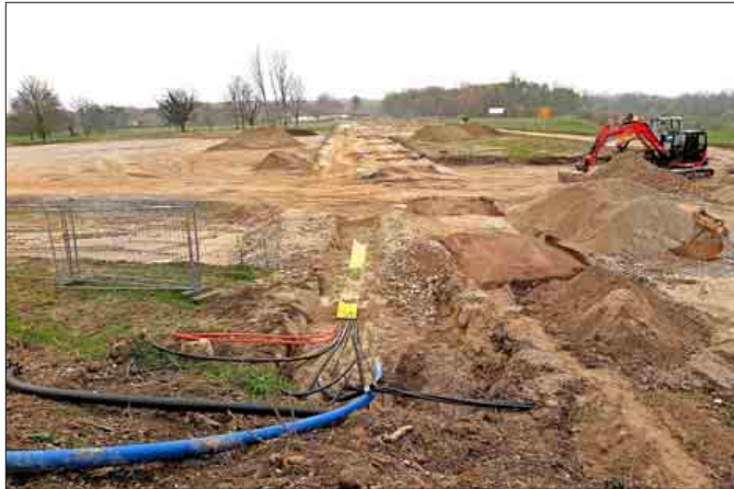
Die Trasse der Erschließungsstraße parallel zur Rheiterrasse. Die Freifläche links nimmt die Baustelleneinrichtung und später das Veranstaltungszelt auf.

Geeinigt hat man sich inzwischen mit dem Eigentümer eines Grundstücks, der bislang Verhandlungen zu Kauf oder Pacht abgelehnt hatte. Diese Verweigerung war der Grund, dass der Radweg parallel der jetzt als Umleitungsstraße ge-