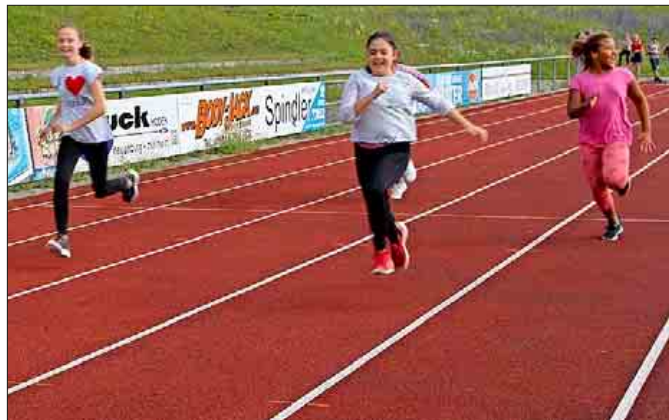
Läuferinnen im Wettkampf