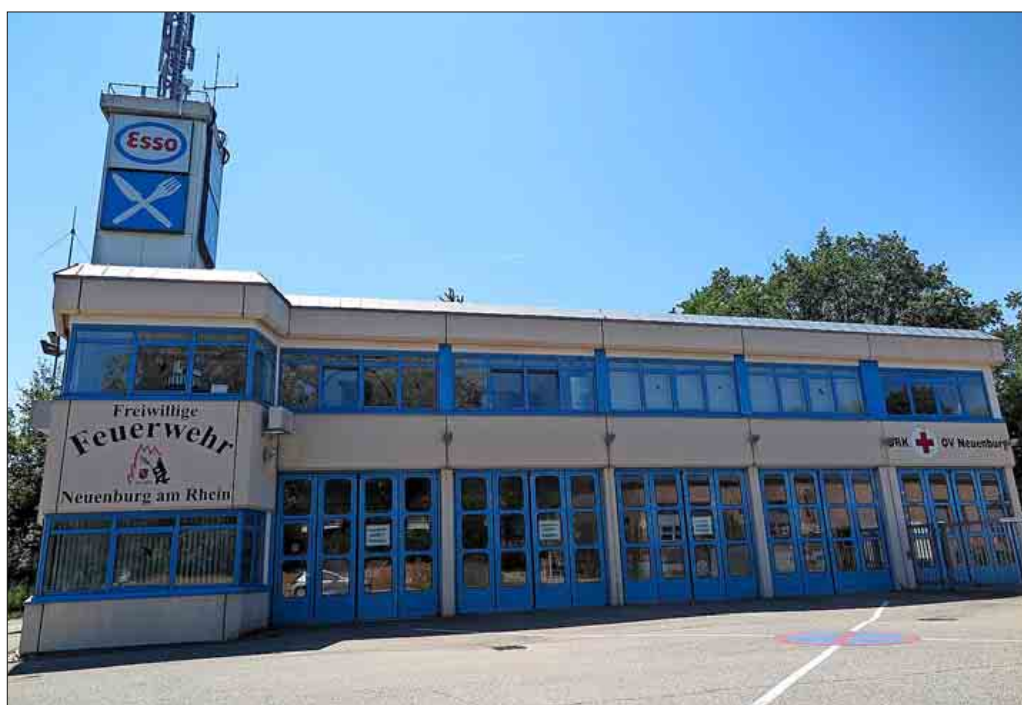
Das Neuenburger Feuerwehrgebäude soll um vier Fahrzeugboxen nach Westen erweitert werden

Eine der großen Investitionen, die im Neuenburger Haushaltsplan eingestellt sind, ist die Erweiterung des Feuerwehrgerätehauses. Die Kostenschätzung liegt bei knapp 700.000 Euro, wobei im laufenden Haushalt eine Rate von 500.000 eingestellt ist. Die restlichen 200.000 Euro werden im Haushalt 2019 bereitgestellt. Außerdem rechnet die Verwaltung mit Zuschüssen in Höhe von 180.000 Euro. Geplant ist der Anbau einer Leichtbauhalle für vier Boxen im Anschluss an den bestehenden Gebäuderiegel in Richtung Westen. In seiner jüngsten Sitzung fasste der Gemeinderat nun den Grundsatzbeschluss zur Umsetzung der Pläne und beauftragte die Verwaltung, die Planungen zu konkretisieren und in Auftrag zu geben. Derzeit befinden sich am westlichen Ende auch noch Räumlichkeiten des DRK, die man auch nach der Erweiterung gerne in der Nähe hätte.