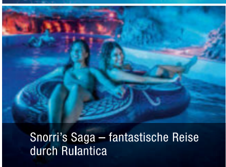
Snorri's Saga – fantastische Reise durch Rulantica