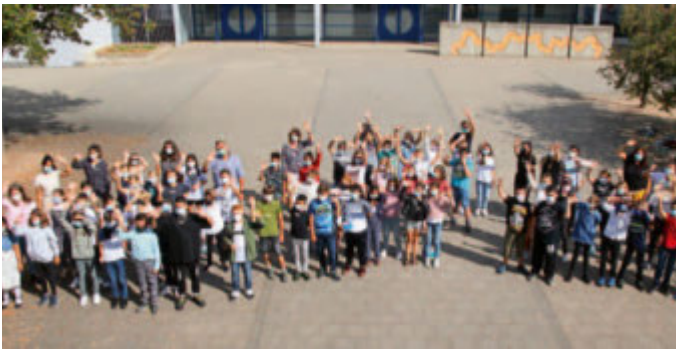
Alle 5. Klässler der Schule im Schuljahr 21/22

Die Mathias-von-Neuenburg Schule ist ein Verbund aus Werkreal- und Realschule. Die Realschule besteht seit mehr als 20 Jahren, ist als offene Ganztagschule konzipiert und wird von rund 380 Schülern besucht. Sie ist zwei- bis dreizügig und hat ein besonderes Profil, das aus den Bereichen Sprachen, Sport und Kunst besteht. Die Werkrealschule ist eine ein- bis zweizügige Schule neuen Typs. Sie führt in einem durchgehenden Bildungsgang bis Klasse 10 zum mittleren Bildungsabschluss und bietet weiterhin den Hauptschulabschluss an. Zusätzlich wird der Übergang in das duale Ausbildungssystem vorbereitet und somit die Grundlage für eine gelingende Berufsausbildung geschaffen. Die Werkrealschule ist ebenfalls eine offene Ganztageschule. Durch den Schulverbund mit der Realschule eröffnet sich zudem die Möglichkeit des fließenden Wechsels bei entsprechenden Leistungen. Werkreal- und Realschule bilden zusammen mit der Rheinschule – Grundschule ein Schulzentrum, zu dem neben den zwei Sporthallen eine Cafeteria und ein Hallenbad gehören.