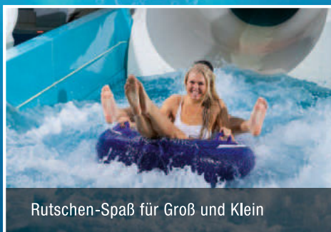
Rutschen-Spaß für Groß und Klein