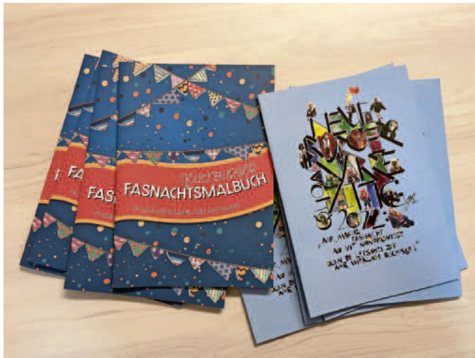
Narrenzittig und Fasnachtsmalbuch

Dieses einzigartige Stückchen Fasnacht kann zum Preis von 3,33 € - die meischde gän vier! - erworben werden.