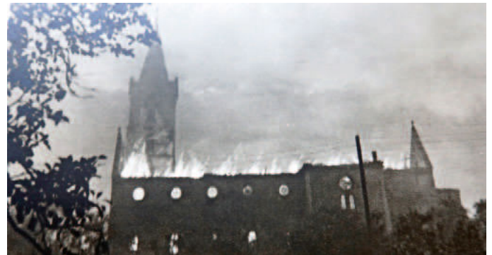
Die beiden historischen Fotos von 1944 zeigen die brennende Kirche und den ausgebrannten Innenraum

Über die alten und historischen Kunstschatze, welche die Liebfrauenkirche schmücken, werden wir in einem weiteren Artikel berichten.