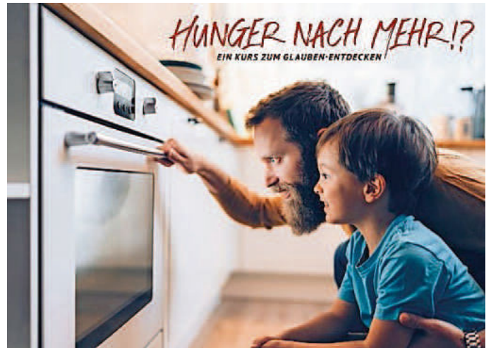
Glaubenskurs: Hunger nach mehr!?