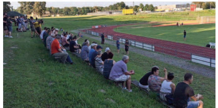
Wie man auf dem Foto erkennen kann, suchten sich viele Fans ein Schattenplätzchen oberhalb der Gegengerade (Westseite).

Narrenzunft D' Rhiischnooge Neuenburg am Rhein e. V.