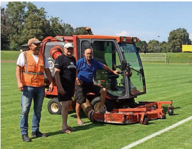
Das Foto beweist, nicht nur Engländer können einen kurzgemähnten „Englischen Rasen“ für ein wichtiges Fußballspiel bereitstellen.