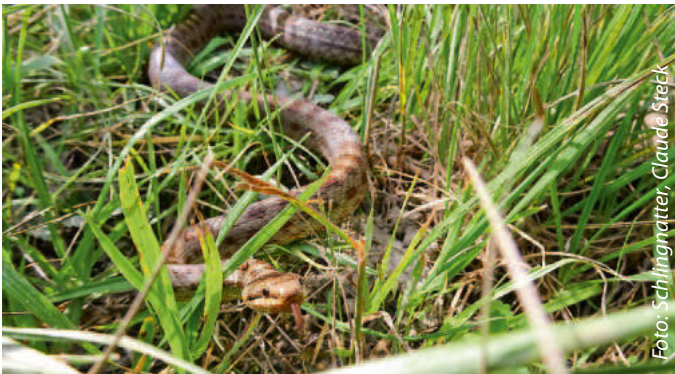
Foto: Schlingnatter

Die am häufigsten vorkommende Schlangenart ist die Ringelnatter ( Natrix natrix , Foto 1) . Sie ist eine scheue Frosch- und Fischjägerin und lebt vornehmlich an Gewässern. Sie schwimmt in fließenden schlängelnden Bewegungen äußerst gut und kann sogar tauchen. Die Ringelnatter besitzt kein Gift und ist somit harmlos. Bei Gefahr sondert sie ein stinkendes Sekret ab. Weibliche Ringelnattern können bis 1,80 m lang werden, die Männchen sind meist kleiner. Ihr besonderes Merkmal sind zwei halbmondförmige, gelbe Flecken an den Seiten des Hinterkopfes. Der Körper weist meist eine hell- bis dunkelgraue Grundfarbe auf, dazu kommen dunkle Flecken auf dem Rücken und an der Seite.