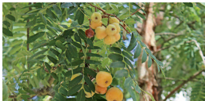
Baumkrone mit reifen Früchten