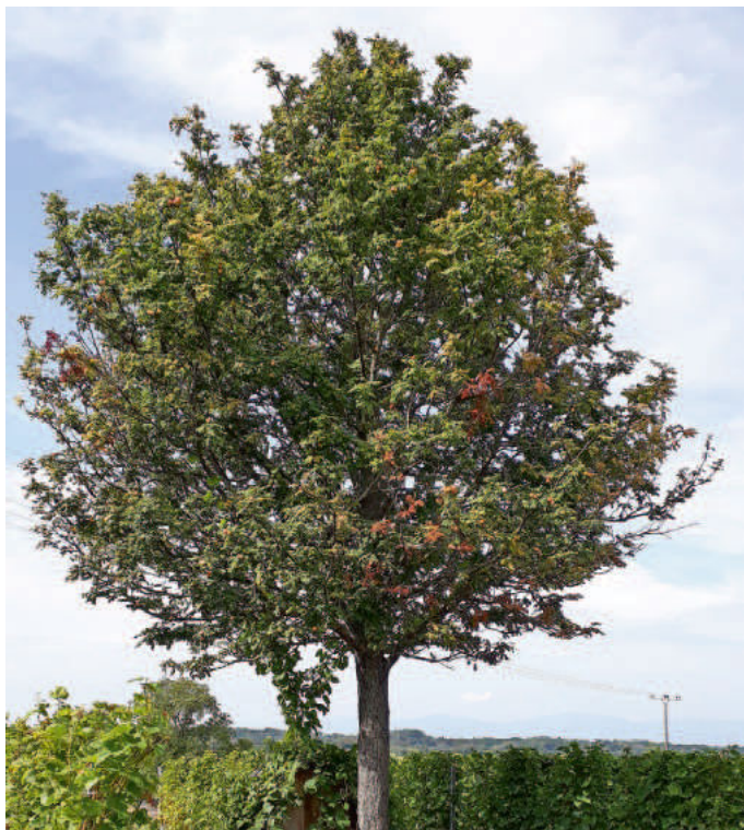
Speierling bei Britzingen

Der Speierling gehört in Deutschland zu den seltensten Baumarten und wurde 1993 als „Baum des Jahres“ ausgezeichnet. Heute gibt es bundesweit schätzungsweise nur noch 5.000 Altspeierlinge. Die jungen Speierlinge sind sehr licht- und wärmebedürftig, sie wachsen langsam und werden gerne von Wild- und Weidetieren „verbissen“. Diese Eigenschaften erschweren die natürliche Verbreitung über Samen oder durch Austriebe von Wurzelbruten.