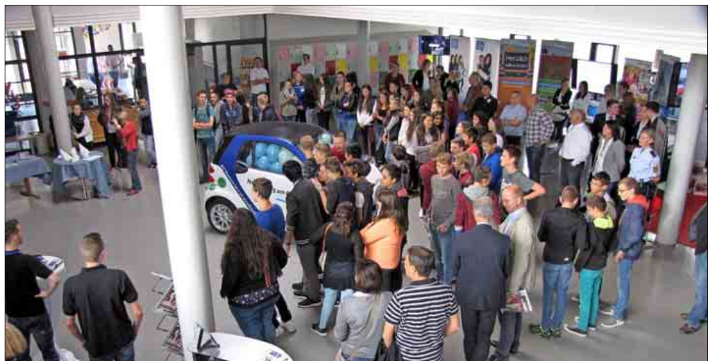
Der Neuenburger Berufsinformationstag NEBIT hilft bei Entscheidungen in der Berufswahl