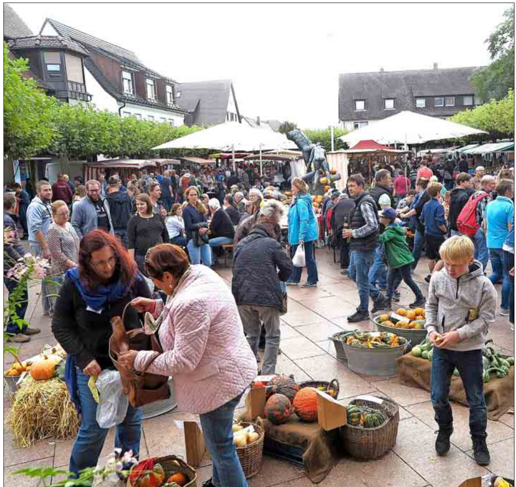
Großer Besucherandrang beim Neuenburger Kartoffelmarkt mit verkaufsoffenem Feiertag

de Ernährung, Kochen mit Kartoffeln, Wissenswertes zu den Kartoffelsorten, Informationen über regionale Erzeugerbetriebe - zu allen Themen gab es nicht nur Flyer, sondern geschulte Ansprechpartner, die sich gerne Zeit für Fragen nahmen. Mit dabei war in diesem Jahr auch ein Infostand der Stadt zur „Sanierungswelle 2“, dem derzeit laufenden Sanierungsprojekt Orts-