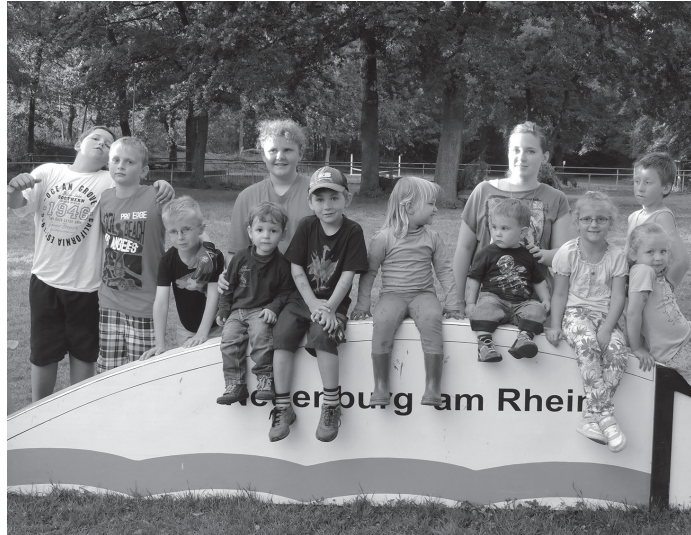
punkt zum Spalierstehen am Samstag 19.07. ist um 14.30 Uhr in Aug-

Letzten Samstag fand unser Grillfest beim Reitsportverein statt. Für die Kinder gab es eine kleine kreative Aufgabe, denn sie durften Umzugstaschen für Fasnacht bemalen. Wie bereits an der GV angekündigt stand auch eine kleine Überraschung an, denn wir bekamen aufgrund unseres 40-jähriges Bestehen, Besuch aus Forchheim und zwar von der Samba Steel Band, die uns mit ihrem karibischen Klängen in sommerliches Karibik Feeling versetzten. Am Sonntag, den 13.07. treffen wir uns um 11.00 Uhr beim HVM zum Nepomuk-Stammtisch, die Frauen unter dem Motto WM. Vorschau: Kränzeln am Freitag 18.07. um 17.30 Uhr im Zigeunerlager. Treff-