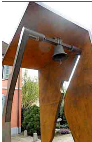
Feierlich enthüllt wurde auf dem Platz vor dem Stadtmuseum die Skulptur mit der historischen Glocke.

diger Standort gefunden worden, ein „Ort der Geschichte“. Auch habe ihn die Geschichte der Glocke inspiriert. Es sollte ein Skulptur entstehen, die den Menschen, die Zerstörung, die Vergänglichkeit, den Wiederaufbau, die Hoffnung, die Zeit und die Geschichte in sich vereine. Der Mensch sei dabei das „Negativ“ für das Leid, aber auch das „Positiv“ für die Freude. Der Mensch fasse den Mut zum Wiederaufbau und gebe Hoffnung. Das sei dargestellt in einer Silhouette, „die sich gegen das Leid aufstreckt, aufsteht und die Last der Glocke auf sich nimmt“. Das Material „Cortenstahl“ sei Symbol für die Vergänglichkeit und die Zerstörung. Es sei ein Material, das sich wandelt, dessen Oberfläche vergänglich wirkt, und das durch die Umwelt zersetzt wird. Das Element Zeit werde symbolisiert durch die begrenzenden Elemente: Boden, Wand und Decke. Die Geschichte werde erlebbar durch das Spannungsfeld zwischen dem „Positiv“ und dem „Negativ“ des Menschen. Zum Schluss seiner Erläute-