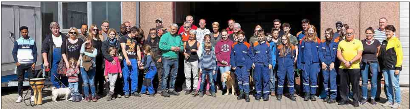
Nach getaner Arbeit und einem stärkenden Vesper: Die Helferinnen und Helfer der diesjährigen Stadtputz-Aktion

Fachfrau. Von Autobatterien, Altöl-Dosen und anderen Gefahrstoffen ganz zu schweigen. Sie und auch andere Helfer wunderten sich, dass sich Menschen die Mühe machen, alten Kreppl wie Sofas, Bauschutt oder Waschmaschinen erst ins Auto einzuladen und dann irgendwo an versteckten Stellen abzukippen. „Die könnten mit dem Aufwand genauso gut zur TREA fahren, da kriegen sie das Zeug zum Nulltarif los“, war die einhellige Meinung. Unverständlich war für die Helfer auch, wie sich beispielsweise die Jugendlichen, die am Cusenier-Areal abhängen, inmitten des dort herumliegenden Mülls wohl fühlen können. „Die hocken da mitten im Dreck und es stört sie nicht“, meinte jemand. Dasselbe gelte auch für die Ufer der Baggerseen.