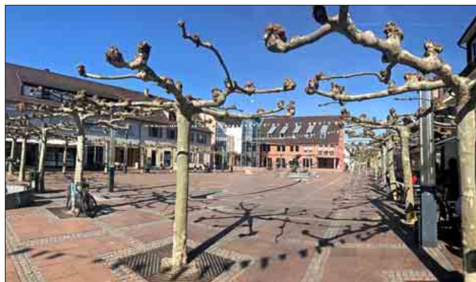
Gelungenes Beispiel für Stadtgestaltung durch Bäume: Die Platanen am Neuenburger Rathausplatz

von der die Arbeitsanforderungen abgerufen werden können, seien es kultivierende oder verkehrssichernde Maßnahmen. Der Anteil von besonders wertvollen Altbäumen ist in Neuenburg im Vergleich zu anderen Städten gleicher Größe geringer. Grund sei die Tatsache, dass im Krieg im Stadtgebiet nicht nur die Häuser, sondern auch die Bäume schwer beschädigt oder ganz zerstört wurden. Die Mehrzahl der Stadtbäume sei gesund, 28 Prozent seien geschwächt und acht Prozent sogar sehr geschwächt erklärte Jetter. Hinzu kommt, dass die beiden in Neuenburg am häufigsten vertretenen Arten, nämlich Ahorn und Baumhasel, den Klimawandel mit zunehmenden Perioden von Trockenheit und Hitze nicht gut vertragen. Werden Bäume neu gepflanzt, würden heute viel größere Mengen an Substrat und viel mehr Platz für den Wurzelbereich gefordert als früher, sagte Jetter. Zwölf Kubikmeter Substrat brauche ein neu gepflanzter Straßenbaum. Planung, Pflanzung und die Pflege entscheiden über Vitalität und Langlebigkeit. Beim Hand-