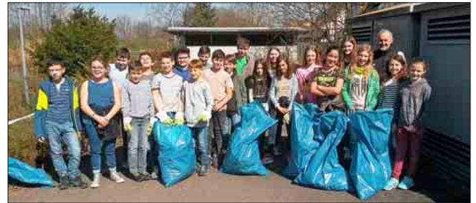
Haben richtig viel gefunden: Die Klasse 6b am Kreisgymnasium