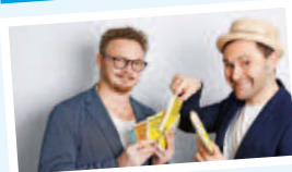
Lesen für Bier