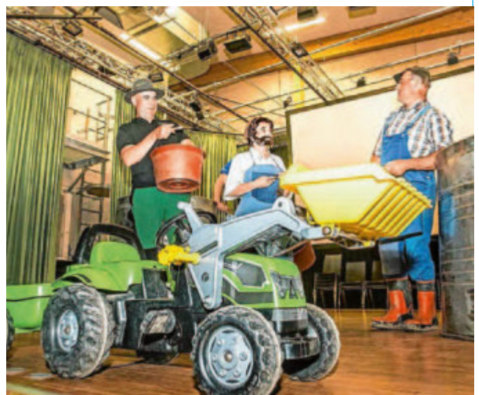
Die Winzer boten mit einem kleinen Theaterstück einen humorvollen Einblick in die Traubenannahme bei der Weinlese.