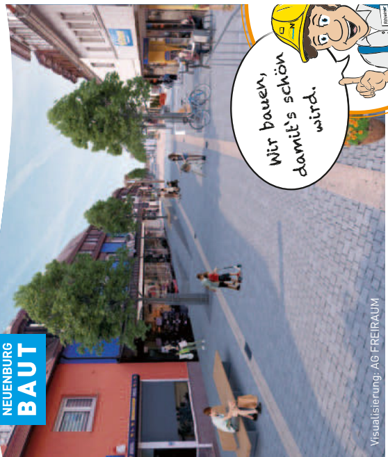
Visualisierung: AG FREIRAUM