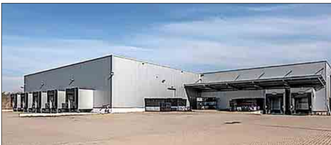
Neue Heimat für die Logistik der Hekatron Manufacturing in Neuenburg