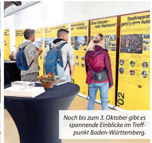
Noch bis zum 3. Oktober gibt es spannende Einblicke im Treffpunkt Baden-Württemberg.