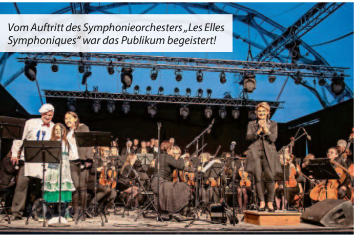
Vom Auftritt des Symphonieorchesters „Les Elles Symphoniques“ war das Publikum begeistert!