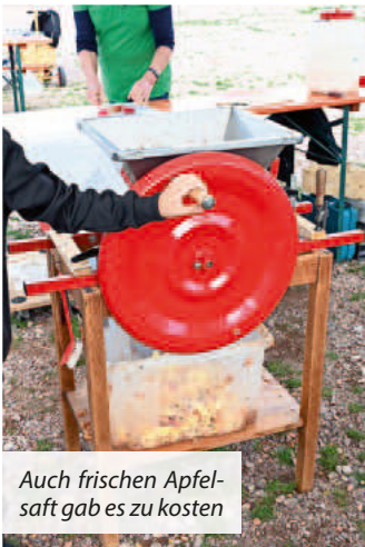
Auch frischen Apfelsaft gab es zu kosten