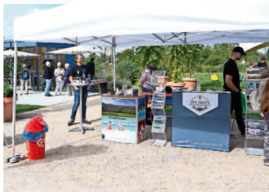
Mit viel Programm präsentierte sich der Südschwarzwald am 18.09.2022 auf der Landesgartenschau