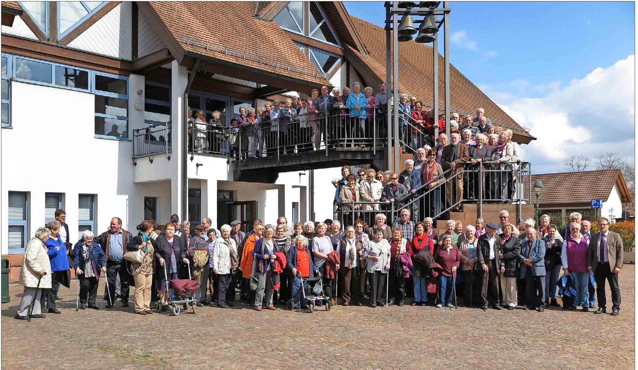
Ein Teil der Gruppe versammelte sich zum Schluss fürs Gruppenfoto auf der Treppe am Stadthaus