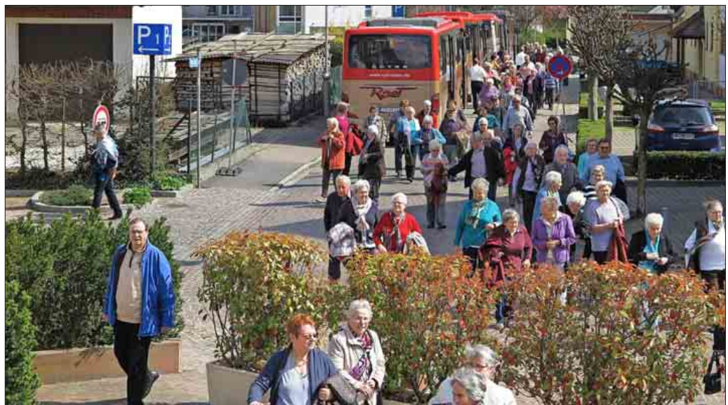
Am Ziel: Die 200 Teilnehmer strömen ins Stadthaus zum Mittagessen

Stadtentwicklung. Dank der sorgfältigen und aufwändigen Vorbereitung unter Federfüh-