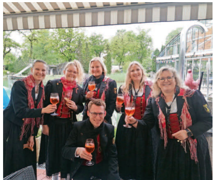
Beim Maiwecken gilt es, die Lippen regelmäßig zu erfrischen, um beim mehrstündigen Musizieren nicht die Puste zu verlieren.

Mit dem Mai hat nun nach der Jahreskonzertpause die Saison der Frühjahrs- und Sommerauftritte begonnen. Wobei das größte Event schon wieder in der Vergangenheit liegt: Am Samstag, 6.5., fand die Rock Night statt, die bei Publikum und Orchester gleichermaßen in positivem Sinne noch eine Zeit lang nachklingen dürfte. Über die kommenden Auftritte werden Sie hier in der Stadtzeitung informiert. fm