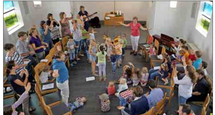
Gottesdienst für Kurze am Sonntag, den 23. Juli 2017

chengemeinde Neuenburg aufgewachsen und hat hier seine Anstöße für das Studium der Theologie erhalten. Im Herbst dieses Jahres wird er mit seiner Familie nach England gehen, um dort an seiner Promotion zu arbeiten. Während der Sommerferien findet kein Kindergottesdienst für Kinder von 0-3 Jahren parallel zum Gottesdienst statt. Für Kinder ab 3 Jahren gibt es dieses Angebot auch während den