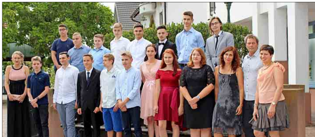
Mathias-von-Neuenburg Werkrealschule Abschlussklasse 2018 – Mittlere Reife-Feier