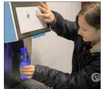
Foto: Wasserspender / Sprudelflaschenverkauf

Die Stadt Neuenburg am Rhein hat es sich etwas kosten lassen: Mit großer Freude nahmen die Werkrealschüler mit dem Jahreswechsel ihren Wasserspender in der Aula der Werkrealschule in Betrieb. Das zusätzliche Schleppen voller Getränkeflaschen von zu Hause hat ein Ende. Jetzt heißt es in den Pausen Wasserflasche füllen und jeder hat die Wahl: ist er/sie eher der spritzig-sprudelige oder der stille Typ? Schüler der SMV (Schülermitverantwortung) verkaufen für ihre Mitschüler – und Lehrer –, spezielle stabile Wasserflaschen zum Befüllen, da viele lieber diese benutzen als die üblichen leeren Pfandflaschen. Aber auch die können selbstverständlich am Wasser-