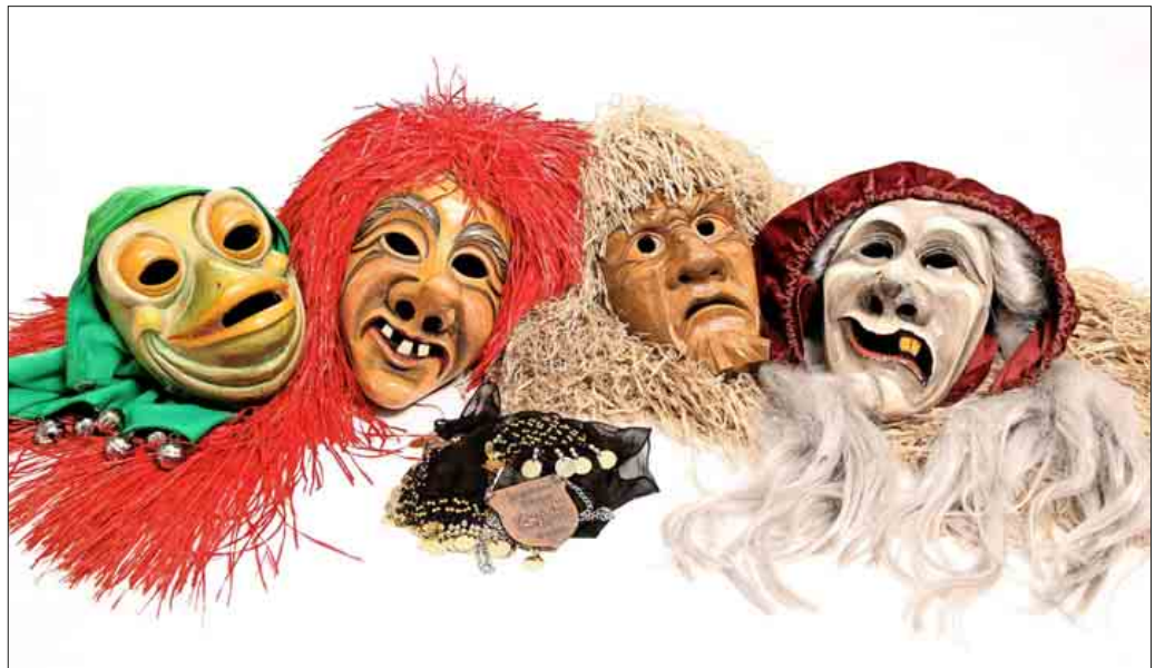
Fasnachtsbälle, Zunftabende und großer Narrenumzug am Fasnachtssonntag