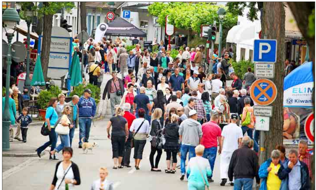
Frühlingserwachen in Neuenburg am Rhein

nicht auf den ersten Blick zu sehen. Es lohnt sich, ab und zu an der Oberfläche zu kratzen und es werden sich wahre Schätze of-