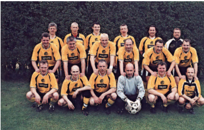
Das Foto zeigt das erfolgreiche AH-Team des FCN.

Es wurde dramatisch. Der FCN lag in Führung, das Endspiel war greifbar nahe. Doch 10 Sekunden vor dem Abpfiff mussten die wacker kämpfenden Neuenburger den Ausgleich hinnehmen. Der Schiedsrichter pfiff die Partie nicht mehr an. Die Enttäuschung war groß, denn langsam ließen Kraft und Kondition nach. Im Elfmeterschießen hatte man keine Chance und stand somit statt im Endspiel nur im Elfmeterschießen um den dritten Platz. Auch dieses wurde, sicherlich nicht mehr so konzentriert, gegen Bochum verloren. Trotzdem, ein 4. Platz für den FCN bei der deutschen AH-Meisterschaft , einfach klasse! Das musste natürlich gefeiert werden, es gab ja noch die „dritte Halbzeit“! Und diese wurde von der FCN-Truppe eindeutig gewonnen. Als Mannschaft mit dem längstem Atem im Festzelt bekam man vom Organisationskomitee T-Shirts mit dem Aufdruck „ Die Standhaftesten “ überreicht. Was für eine überragende Leistung...ich meine natürlich das Fußballergebnis!