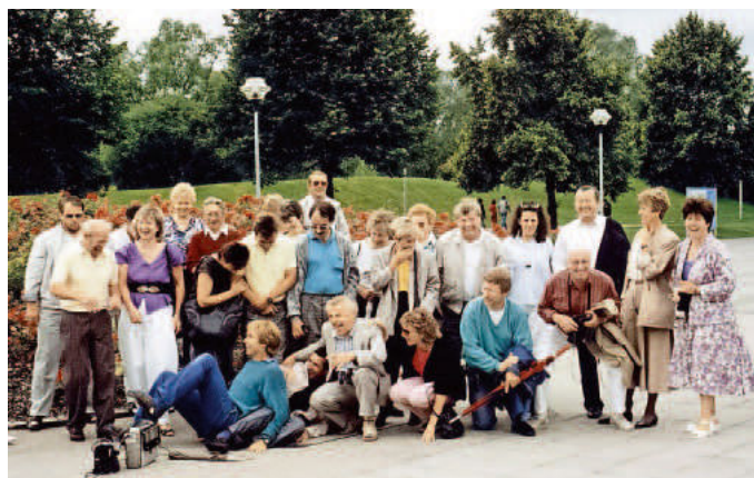
Das Foto zeigt die „AH“ mit „AD“-Begleitung bei einem der zahlreichen Ausflüge.