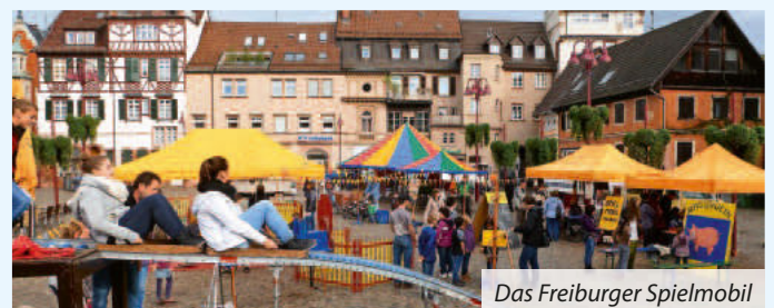
Das Freiburger Spielmobil

Veranstalter: Stadt Neuenburg am Rhein und Gewerbeverein Neuenburg am Rhein