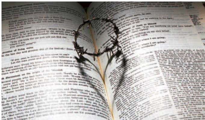
Fürwahr ER trug unsere Schuld!