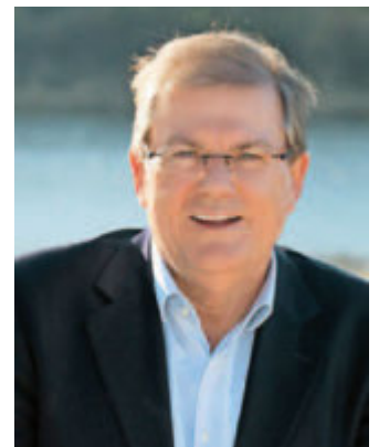
Joachim Schuster Bürgermeister

Immer mehr Privatpersonen und Institutionen richten Hilfsangebote für Menschen ein, um vor allem für ältere Menschen zu deren Schutz den Kontakt in die Öffentlichkeit zu vermeiden. Eine Gratwanderung im Hinblick auf die Vereinsamung älterer Menschen. So melden sich bei der Stadtverwaltung unter „nachbarschaftshilfe@neuenburg.de“ viele die helfen wollen. Aber wenige Hilfsbedürftige geben sich zu erkennen. Deshalb sind unterschiedliche Wege erforderlich, um einsame und hilfsbedürftige Menschen zu erreichen. Ermutigend sind die vielen Anstrengungen in unserer Stadt, Gutes tun zu wollen. Dafür möchte ich mich ganz herzlich bedanken. Mit einem Osterfest der besonderen Art können wir hoffentlich die Wende zum Besseren schaffen. Bleiben sie gesund und stärken sie den Zusammenhalt in unserer Stadt und den Ortsteilen.