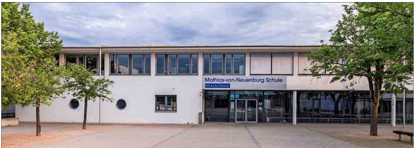
Die Stadt Neuenburg will in den nächsten zweieinhalb Jahren knapp 793.000 Euro in die Sanierung der Mathias-von-Neuenburg-Schule investieren umso einem Investitionsstau vorzubeugen.

und die Beleuchtung in den Klassenzimmern auf LED-Technik umgestellt werden, erläuterte die zuständige Teamleiterin Sibylle Maas. Die Arbeiten sollen jeweils in den Sommerferien 2019, 2020 und 2021 durchgeführt werden. Diesen Sommer soll mit der Umstellung der Beleuchtung in den Klassenzimmern auf LED-Technik sowie mit den Decken- und Bodenbelägen begonnen werden.