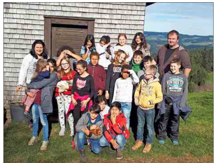
Hühner streicheln, Kühe melken und Schweine bürsten ...

wurde. Die Schüler konnte den Bauernhof mit allen Sinnen erleben, sie durften die Kühe von der Weide holen, teilweise eine echte Mutprobe, durften die Kühe melken und füttern, die Schweine bürsten, Hühner streicheln, Eier ausnehmen auf den zwei Pferden reiten und vieles mehr. Neben dem naturwissenschaftlichen Wissenszuwachs wuchs die neue Gruppe zu einer echten Klassengemeinschaft zusammen.