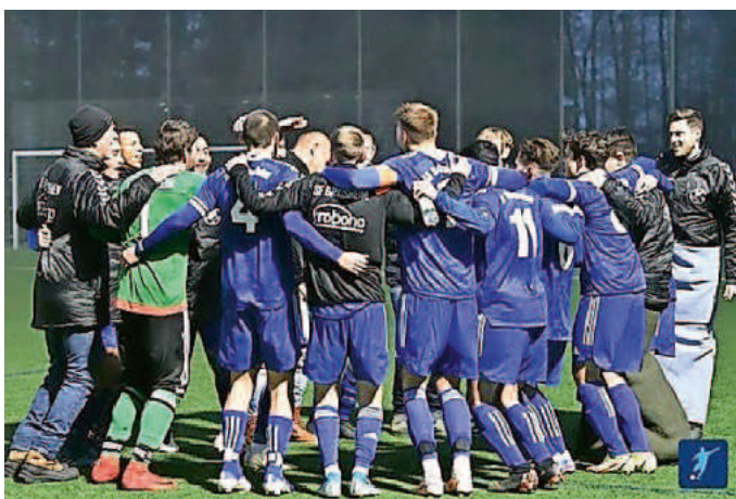
Hier jubelt die Grißheimer „Erste“ den 5:1 Auswärtssieg in Kappel. Glückwunsch an unsere sportlichen Konkurrenten.

Schauen wir noch zur „Ersten“ Mannschaft der Sportfreunde Grißheim, die als derzeitiger Tabellenfünfter (ein Platz und vier Punkte hinter unserer Ersten) eine große Überraschung in der Kreisliga A ist. Ähnlich wie unser Team hat sie sich durch eine Siegesserie (7 Siege in 9 Spielen) in den erweiterten Favoritenkreis gespielt, wobei sie bereits zu Saisonbeginn dem derzeitigen Tabellenführer Gundelfingen/Wildtal beim 4:0-Sieg keine Chance ließ. Aus meiner Sicht kann man sie ebenfalls zu den Aufstiegs-kandidaten zählen und das lässt uns auf eine aus Neuenburger „Stadtsicht“ spannende Rückrunde hoffen.