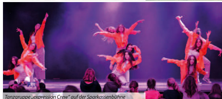
Tanzgruppe „expression Crew“ auf der Sparkassenbühne