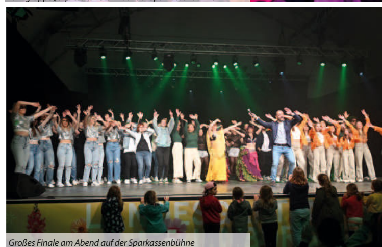
Großes Finale am Abend auf der Sparkassenbühne