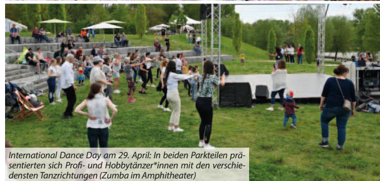
International Dance Day am 29. April: In beiden Parkteilen präsentierten sich Profi- und Hobbytänzer*innen mit den verschiedensten Tanzrichtungen (Zumba im Amphitheater)