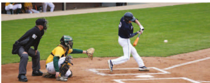
Die Atomics erfolgreich beim Schlag

Die Baseballer der Neuenburg Atomics treffen am kommenden Samstag, den 7. Mai in der 2. Bundesliga auf die Hünstetten Storm. Spielbeginn von Spiel 1 ist um 12 Uhr und Spiel 2 beginnt um ca. 14.30 Uhr im Atomics Baseballpark.