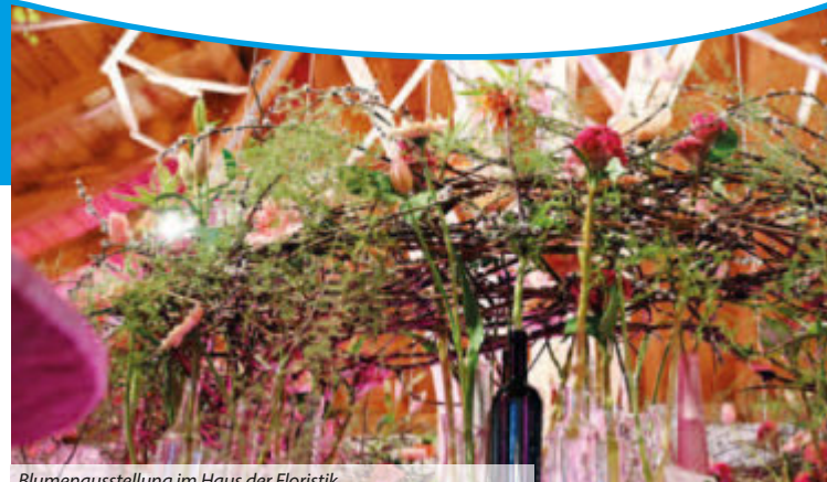
Blumenausstellung im Haus der Floristik

Das komplette Veranstaltungsprogramm steht online unter www.neuenburg2022.de/veranstaltungen/ zur Verfügung und liegt als gedruckte Version zum kostenlosen Mitnehmen an verschiedenen Stellen aus.