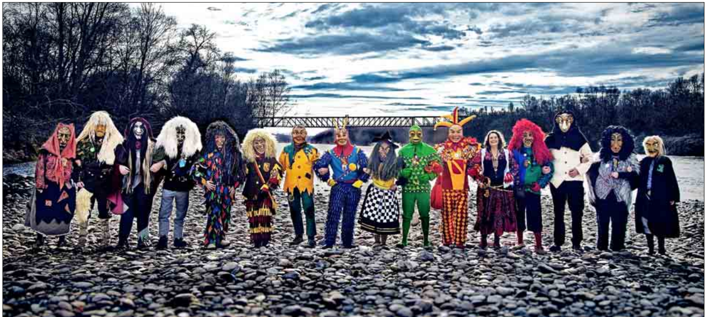
Närrisches Treiben im Narrendorf auf dem Rathausplatz. Kaffee und Kuchen nach dem Umzug im Stadthaus und in St. Bernhard. Weitere Informationen zur Neuenburger Fasnacht auf Seite 10.