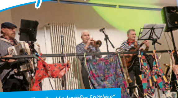
Kapelle „Markgräfler Spätlese“

Mitteilungsblatt mit den amtlichen Bekanntmachungen der Stadt Neuenburg am Rhein mit den Stadtteilen Zienken, Grißheim und Steinenstadt