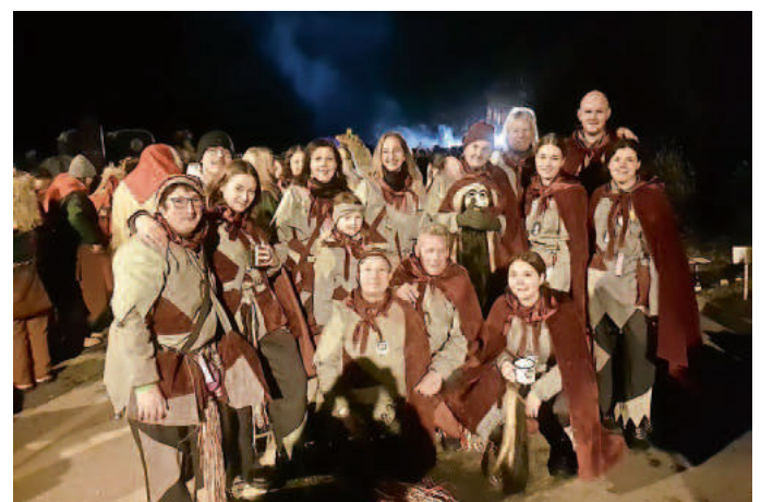
Die Plooggeister am Bollschweiler Umzug

Vergangenes Wochenende haben wir Plooggeister am Bollschweiler Fackelumzug teilgenommen und freuen uns nun auf die nächsten Veranstaltungen am kommenden Samstag, 04.02.2023 . Wir treffen uns am Zigeunerlager auf dem Marktplatz in Neuenburg, um dann im Anschluss das Narrentreffen der Burgender Rätzer in Mauchen zu besuchen.