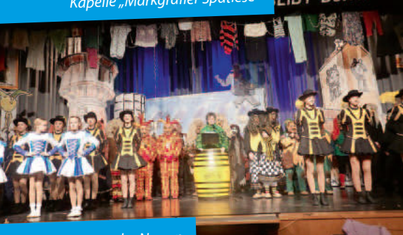
Einzug der Narren