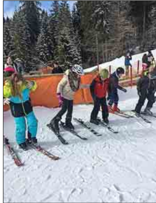
„Ski und Rodeln gut“ beim Wintersporttag 2018 der Werkrealschule

Die Schüler der Klassen 5 bis 9 der Werkrealschule durften bei klirrender Kälte, aber strahlendem Sonnenschein einen erlebnisreichen Tag im Schwarzwald verbringen. Die Schüler fanden beste Schneebedingungen vor und konnten ihr Können auf Skiern und Snowboard auf der gut präparierten Piste unter Beweis stellen. Unterstützt wurden viele Schüler in Kursen von professionellen Skilehrern. Die Lehrer und zwei Praktikanten der Pädagogischen Hochschule begleiteten die Schüler auf Skiern und Schlitten. Die Schlit-