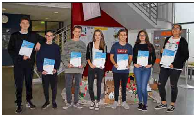
Die Absolventen des EuroBors-Praktikums 2017 mit den Sprachenpässen