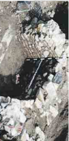
Archäologische Grabungen in Neuenburg am Rhein

Empfang durch die Stadt Neuenburg am Rhein