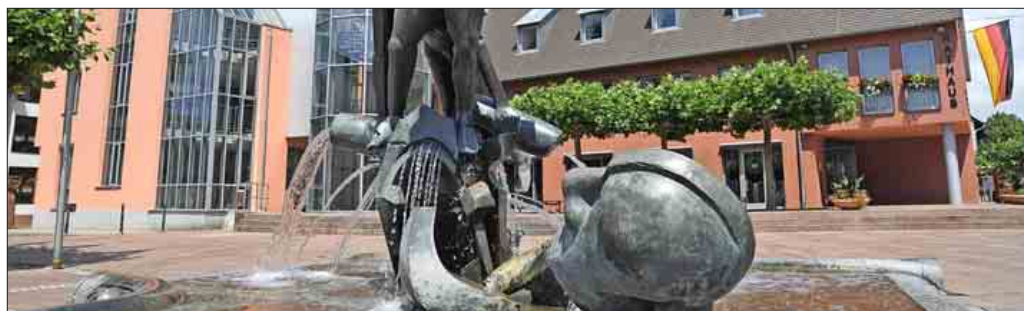
Ende der öffentlichen Bekanntmachungen