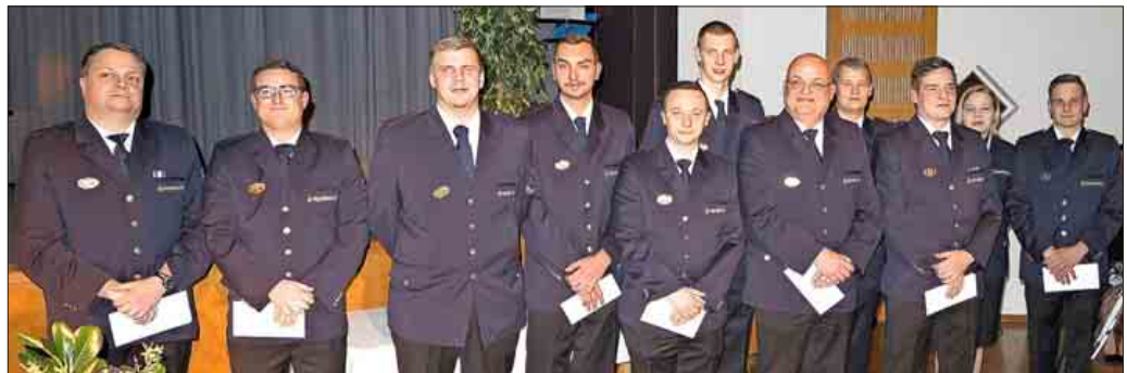
Zwölf Mitglieder der Neuenburger Feuerwehr haben das goldene Feuerwehrleistungsabzeichen erworben. Sie wurden im Rahmen des Neujahrsempfangs geehrt.