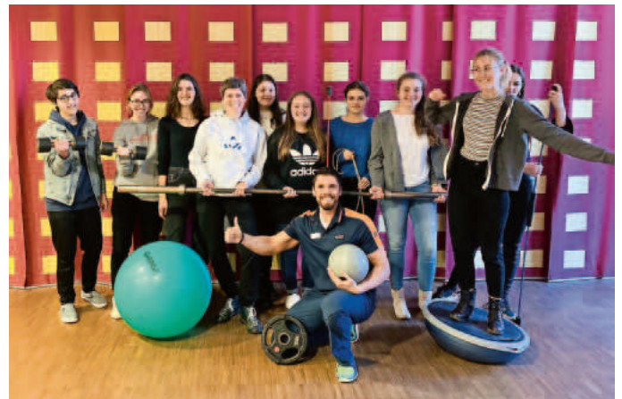
Alle top-fit bei Injoymed in Müllheim

Der Sportkurs bedankt sich beim Injoymed-Team für den detaillierten und kompetenten Einblick in die komplexen Zusammenhänge des gesundheitsorientierten Fitnesstrainings.