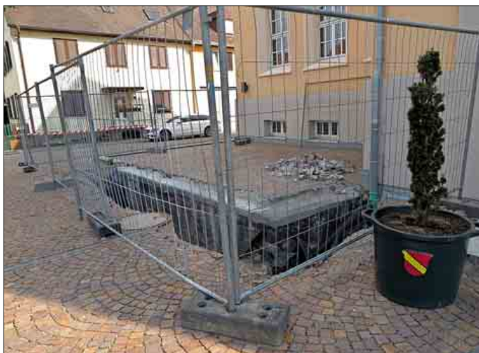
Die Baustelle am Bildungshaus, wo Nässe in den Pelletbunker eingedrungen ist.