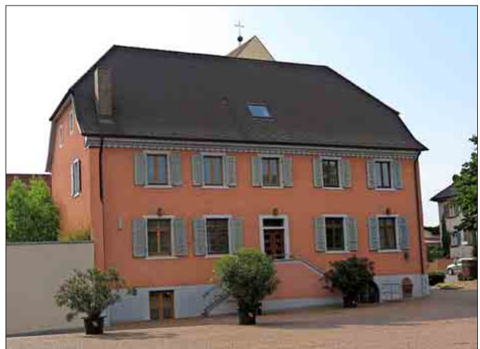
Das neue Dachfenster im Museum dient dem Rauchabzug im Brandfall.