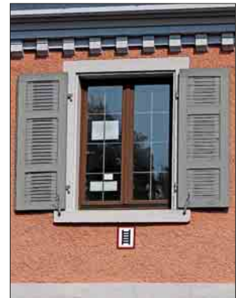
Das gekennzeichnete Rettungs-fenster im Obergeschoss des Museums für Stadtgeschichte.

Zurückgebaut wurde in den Pfingstferien die Holzhackschnitzelanlage in der Realschule. Die neue Anlage soll in den Sommerferien eingebaut werden.