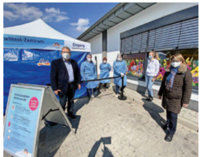
Seit 16.4.21 ist das dm-Schnelltestzentrum in Neuenburg am Rhein eröffnet

Gemeinsam ziehen wir Corona den Stecker.